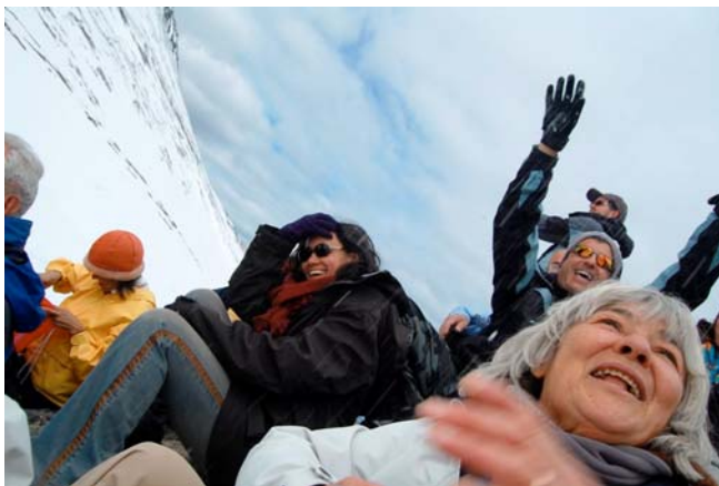
Ushuaia – Argentina 2007.

A experiência de contato com novas paisagens foi muito significativa, até porque escolhemos um roteiro que fugia um pouco do tradicionalmente esperado. Mas a experiência de contato com os grupos locais se mostrou extremamente significativa. Foi o início de uma teia de relações que extrapolou fronteiras e barreiras lingüísticas. Literalmente os participantes ganharam o mundo, rompendo os limites perceptuais que tornam os países tão distantes.