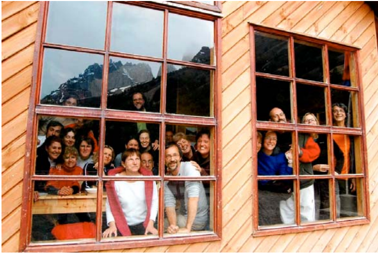
Torres del Paine – Chile 2007.

been changing and we're hungry for a different kind of food: beauty, transcendence, new paradigms to believe and live. The Pathways to Transformation approach us of some different doors. Only each one of us can open it. Supported by lovely group and guided for experts, you're invited do create you own reality.