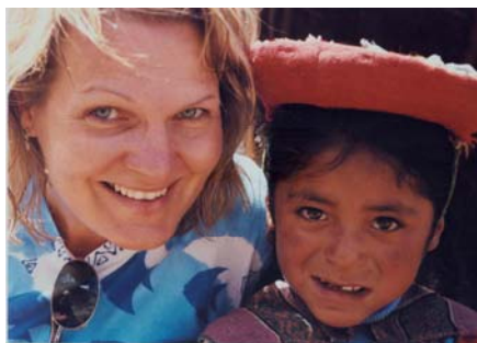
Peru – 2004.

2007 - Extremo sul da América Latina: Rio Grande do Sul, Montevideu, Buenos Aires, Patagônia Argentina e Chilena, Puerto Madryn, Ushuaia, Torres del Paine e Chaltén.