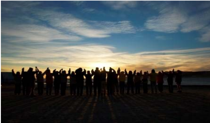
Península Valdéz – Argentina 2007. Vivência na praia com as baleias.

Em uma sociedade individualista e reducionista esse Processo faz o caminho inverso, proporcionando aos participantes a vivência de amplidão e grandiosidade de nosso planeta. A pessoa que passa por este processo, desperta para uma inteligência relacional como preceito, uma solidariedade como vivência do cotidiano e uma visão transcendente de si mesmo como um andarilho do universo.