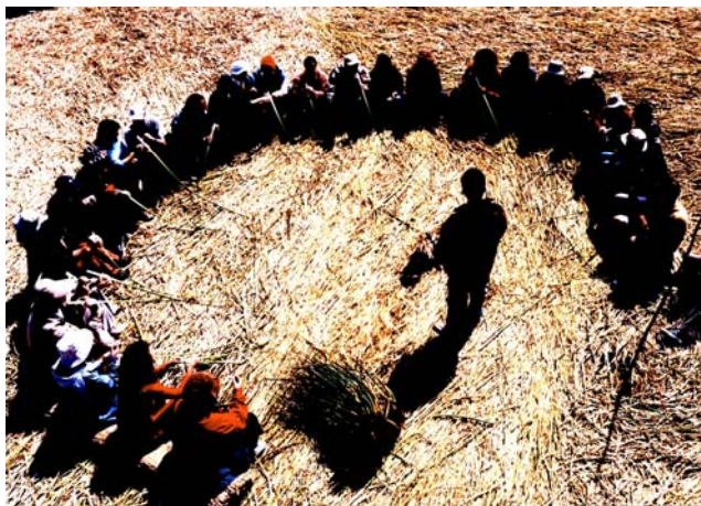
Lago Titikaka – Peru – 2004.