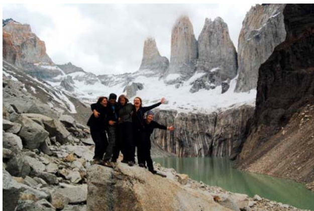
Torres del Paine – Chile – 2007.

• Não posso deixar de dizer que nestes seis meses em diferentes lugares tive apoio e carinho de muitos amigos. Todos da Biodanza. Todos que “lá do outro lado do mundo” também acreditam na teia do amor. Em especial Manu, Livia, Elizandra, Teresa e outros.