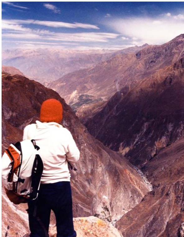
Cânion del Colca - Peru - 2004.